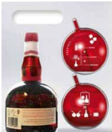
71 | Grand'O Grand Marnier Cordon Rouge Der einzige Orangenlikör mit echtem Cognac. 40 % Vol., in Geschenkpackung mit 2 originellen Grand O'Trinkkugeln