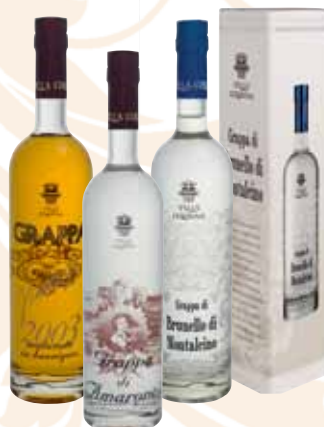
90 | Villa Colonna Levitrasparenze Vintage 2003 Bereits seit vielen Jahren hat man sich im Hause Villa Colonna der Produktion von hochwertigen Premium-Grappen gewidmet. Nur die besten Qualitäten werden für die Reihe Villa Colonna ausgewählt. La Dolce Vita für alle Italien-Liebhaber. Die luxuriösen „LEVITRASPRENZE“ beinhalten die allerfeinsten Superpremium-Qualitäten aus dem Hause Villa Colonna in ihren individuell gestalteten Klarglasflaschen. Ein optischer sowie geschmacklicher Hochgenuss für die Kenner und Genießer. 40 % Vol., 0,7 l, in Geschenkpackung Villa Colonna Levitrasparenze Amarone, 40 % Vol., 0,7 l, in Geschenkpackung Villa Colonna Levitrasparenze Brunello di Montalcino, 40 % Vol., 0,7 l, in Geschenkpackung