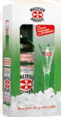
86 | Malteser-Aquavit mit Ritzenhoff-Glas - man gönnt sich ja sonst nichts - 38 % Vol., 0,7 l, in Geschenkpackung mit Glas