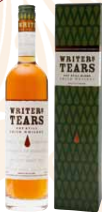
44 | Writer's Tears Irish Blended Pot Still Whiskey. Die Vermählung von irischem Pure Pot Still Whiskey und irischem Single Malt Whiskey machen diesen milden und fruchtigen Whiskey zu einer einzigartigen Besonderheit. Gewidmet wurde er allen irischen Schriftstellern der Vergangenheit, Gegenwart und Zukunft. Man sagt, wenn ein irischer Schriftsteller weint, dann weint er Tränen aus purem Whiskey. 40 % Vol., 0,7 l, in Geschenkpackung