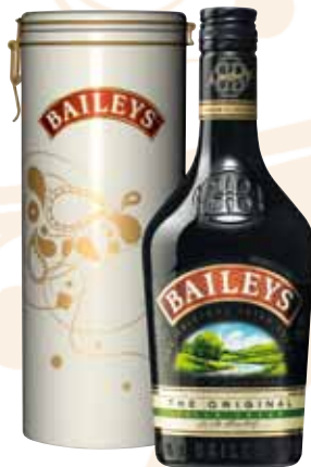
70 | Baileys Der Cream-Likör Klassiker aus Irland mit echtem irischem Whiskey. 17 % Vol., in attraktiver Kaffeedose