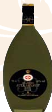
88 | Aalborg Jule Akvavit 2011 Sonder-Edition, der 30. Jahrgang dieser traditionsreichen Aquavit- Spezialität aus Dänemark 47 % Vol., 0,7 l, in Geschenkpackung o. Abbildung