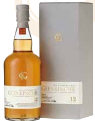
06 | Glenkinchie, 12 Jahre der leichte Lowland Malt 43 % Vol., 0,7 l, in Geschenkpäckung