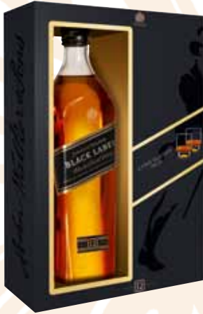
40 | Johnnie Walker Black Label 12 Jahre gereifter Premium Blended Scotch Whisky. 40 % Vol., 0,7 l, in Geschenkpackung mit zwei hochwertigen Design-Tumbler