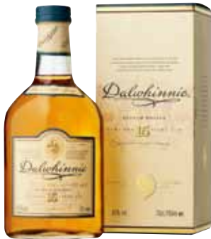
01 | Dalwhinnie, 15 Jahre der sanfte Highland-Malt. 43 % Vol., 0,7 l, in Geschenkpäckung