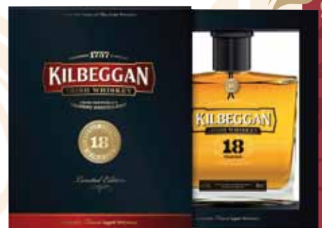
45 | Kilbeggan 18 Jahre Kilbeggan ist irisch und bedeutet so viel wie „kleine Kirche“. Ein typischer irischer Whiskey, aus Gerste und Mais destilliert, mild und mit sanften Gewürznoten, gefolgt von einer leichten Honigsüße und dem Duft von Zitrusfrüchten, Vanille und Eichenholz sowie süßen Fruchtaromen. 40 % Vol., 0,7 l, in Geschenkpackung