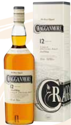
03 | Cragganmore, 12 Jahre der genial-kernige Speyside Malt. 40 % Vol., 0,7 l, in Geschenkpäckung