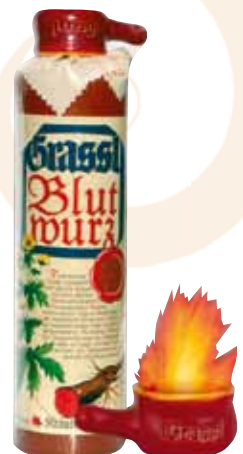
73 | Grassl Blutwurz eine Kräuterspezialität aus den Bergen. 48 % Vol., 0,7 l, mit Pfanderl aus Keramik