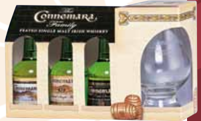
42 | Connemara Probierset Connemara Peated Single Malt Irish Whiskey ist der einzige rauchige Single Malt Irlands. Er ist benannt nach der außergewöhnlichen Moor- und Seenlandschaft im Westen des Landes und so schmeckt er auch: In der Nase liegen angenehme Töne von Honig und Kaminfeuer während im Mund leichte Fruchtaromen und kräftige Torfnoten zum Vorschein kommen. Dieses 3er Probierset beinhaltet neben einer 40%igen Abfüllung auch die Fassetärke sowie den weniger rauchigen 12 Jahre alten Connemara. 40 % Vol., Probierset in Geschenkpackung mit Glas