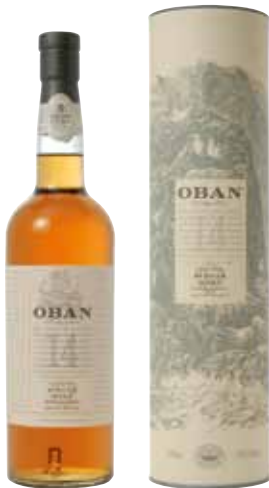
04 | Oban, 14 Jahre der Klassiker aus den westlichen Highlands. 43 % Vol., 0,7 l, in Geschenkpäckung