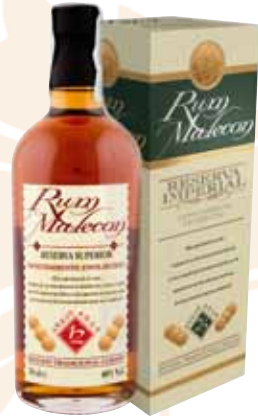
65 | Rum Malecon 12 Jahre Der aromatische Rum Malecon wird auf Panama streng nach alter kubanischer Methode hergestellt. Die lange Reifung in Eichenholzfässern gibt ihm die außergewöhnliche Würze, Reife und Finesse. 12 Jahre 40 % Vol., 0,7 l, 15 Jahre 40 % Vol., 0,7 l 25 Jahre 40 % Vol., 0,7 l