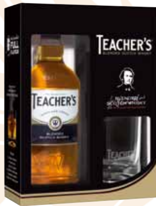
41 | Teacher's Highland Cream Seitdem William Teache im Jahre 1830 seinen ersten Blended Scotch herstellte, sind über 180 Jahre vergangen. Heute steht Teachers Highland Cream für schottische Tradition und Erfahrung. Teachers ist reich und kraftvoll im Geschmack, besonders aufgrund des außergewöhnlich hohen Malt-Anteils von 45 %, der durch den Single Malt Ardmore geprägt wird, dem Herzstück dieses Blended Scotches. 40 % Vol., 0,7 l, in Geschenkpackung mit Premium-Tumbler