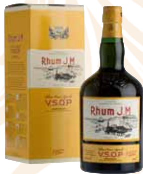
67 | JM Rhum V.S.O.P. Als ein „Aged Rum“ muss V.S.O.P. im J.M. Keller mindestens 4 Jahre in Eichenholzfässern reifen, bevor er in Martinique, der franz. Westindischen Insel, abgefüllt wird. Er wird durch Destillation von reinem Zuckerrohr gewonnen. V.S.O.P. zeichnet sich durch seinen schweren Körper und seinen intensiven Geschmack aus. Er kann pur, mit Eis oder in Cocktails getrunken werden. 43 % Vol., 0,7 l in Geschenkpackung