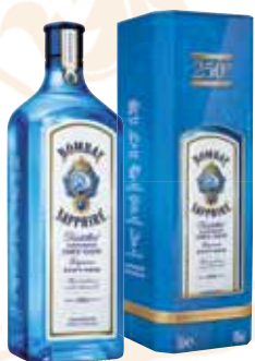
89 | Bombay Sapphire London Dry Gin – Geschmack der inspiriert – 40 % Vol., in Geschenk- packung