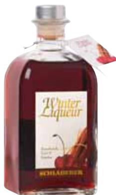
72 | Schladerer Winter-Liquor bestes Sauerkirschwasser, eine raffinierte Komposition ausgesuchter Kräuter und eine dezente Nuance Zimt, geben diesem Likör eine besondere unnachahmliche Note. 25 % Vol., 0,5 l Karaffe