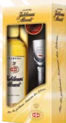
87 | Aalborg Jubiläums Akvavit aus Dänemark, besonders sanft und mild 42 % Vol., 0,7 l, in Geschenk- packung mit Originalglas