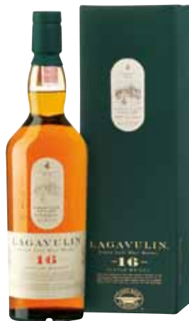
05 | Lagavulin, 16 Jahre der torfige Malt von Islay 43 % Vol., 0,7 l, in Geschenkpäckung