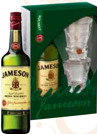
43 | Jameson Irish Whiskey, die bedeutendste Marke Irlands und die weltweite Nr.1. 40 % Vol., 0,7 l, in Geschenkpackung mit 2 Gläsern