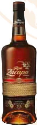
66 | Ron Zacapa Centenario 23 der in ex-Bourbon und ex-Sherry-Fässern in 2300 m über dem Meeresspiegel gelagerte Centenario 23 ist das Herz der Ron-Zacapa-Familie. Seine natürliche Süße und sein außerordentlicher Geschmack sind einzigartig. 40 % Vol., 0,7 l, in Geschenkpackung o. Abb.