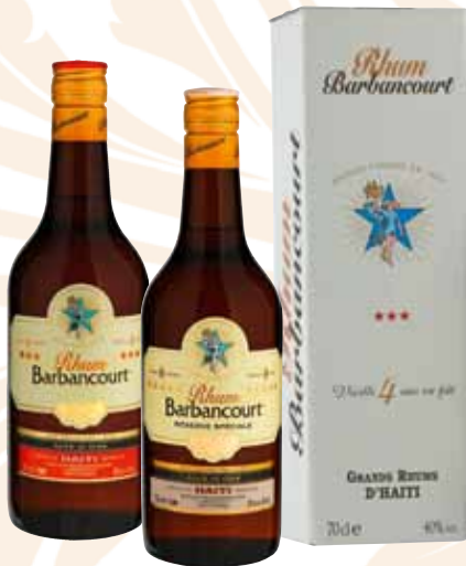
63 | Barbancourt 4 Jahre (Three Stars) 40 % Vol., 0,7 l, in Geschenkpackung