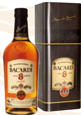
68 | Bacardi Ron 8 Años Reserva Superior, aged with Passion das Meisterstück für puren Rumgenuss 40 % Vol., 0,7 l, in Geschenkpackung