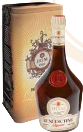
69 | Bénédictine Dom Deo Optimo Maximo - dem höchsten Gott geweiht: ein überirdischer Liqueur und ein Muss für jede gute Bar 40 % Vol., 0,7 l, in Geschenkpackung