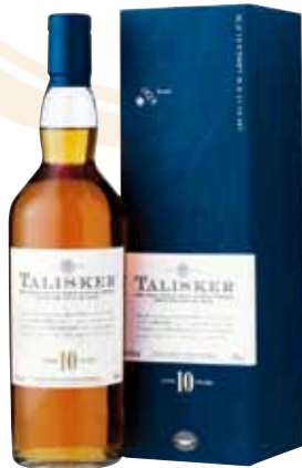
02 | Talisker, 10 Jahre Isle of Skye Malt, körperreich, ausdrucksvoll. 45,8 % Vol., 0,7 l, in Geschenkpäckung